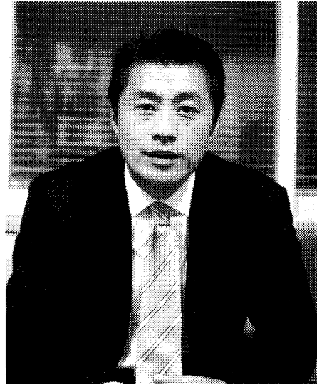
実情を我々に届けてほしい

までも交付金を使って安全、環境対策を進めてきました。こうした公的なものに使われてきたという認識は十分あったのですが、税調では暫定税率をどうするか、という議論をまず行わなければなりません。暫定税率が廃止ということになれば、それを前提にしている交付金もなくなるということで当初はDというランクになったと思います。